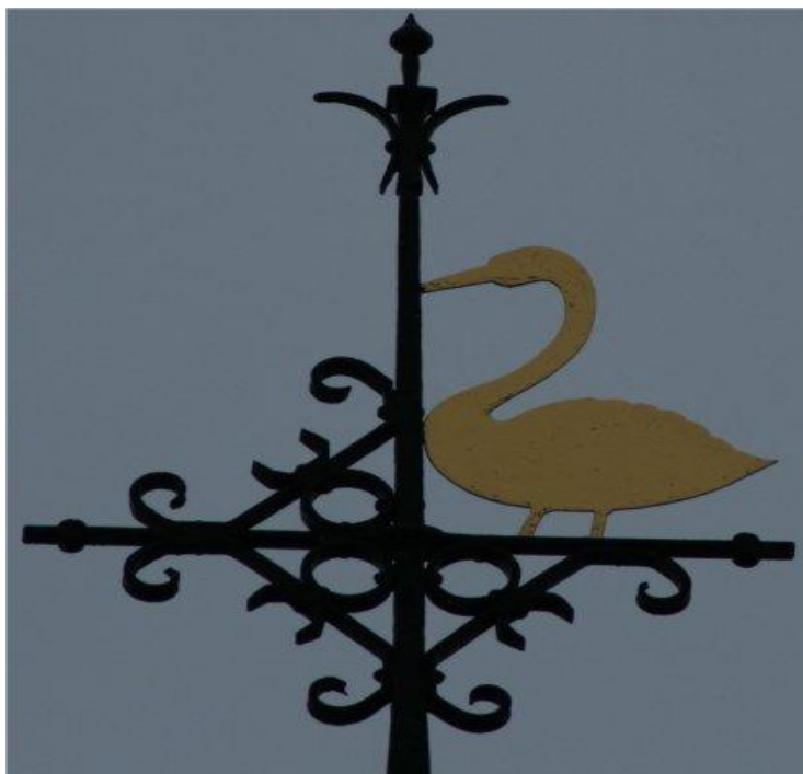
Windvaan van de Lutherse kerk in Zwolle