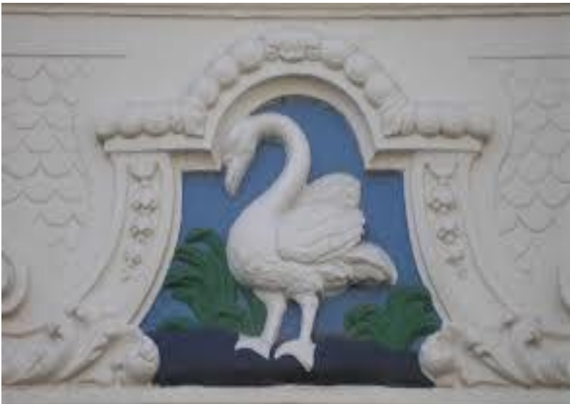
GEVELSTEEN VAN EVANGELISCHE LUTHERSE KERK IN ARNHEM